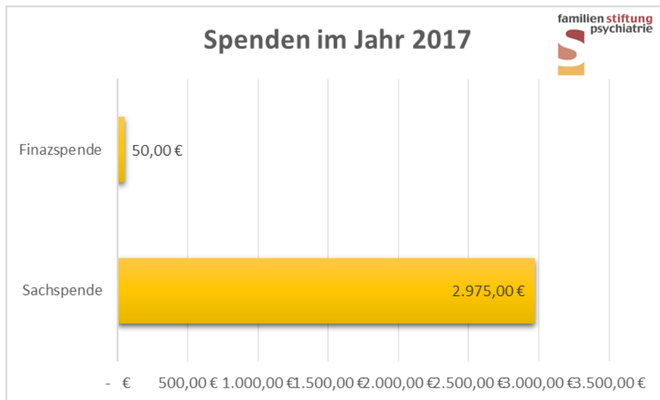
Abb. 1: Spenden für die Familienstiftung Psychiatrie im Jahr 2017

In diesem Jahr gab es für die Familienstiftung Psychiatrie eine Sachspende in Form einer Homepageentwicklung. Die Kosten der Sachspende belaufen sich auf 2.400 €.